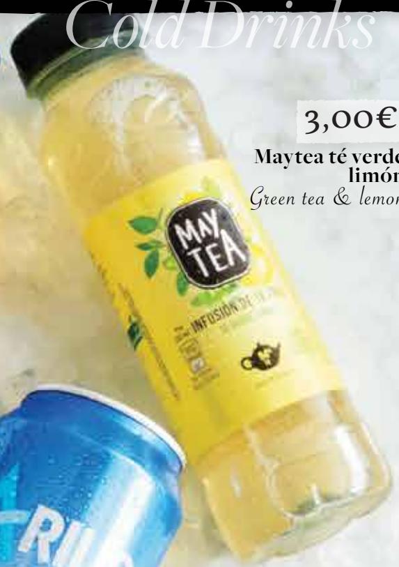
3,00€ Maytea té verde limón Green tea & lemon