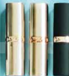
Trio Red Addiction L'OREAL Pintalabios Lipstick