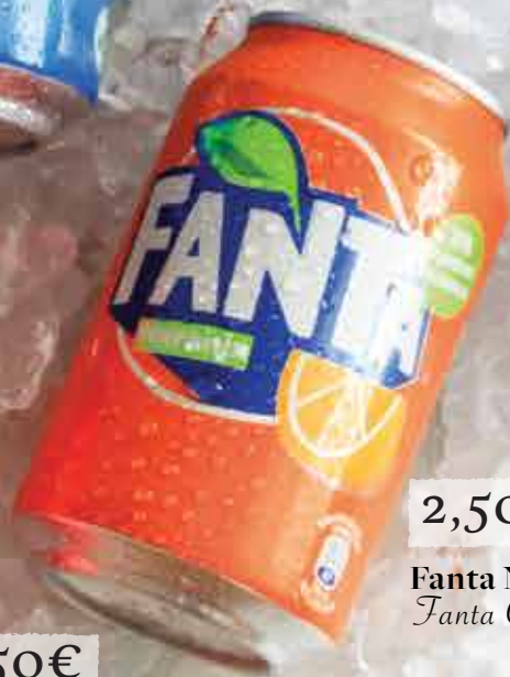
2,50€ Fanta Naranja Fanta Orange