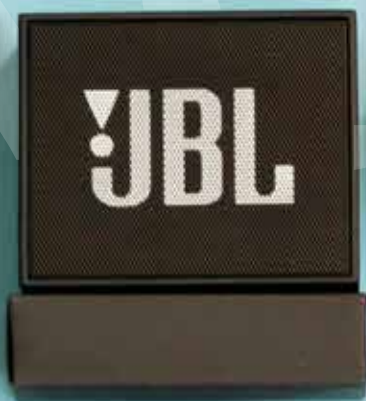
Altavoz inalámbrico JBL Go Wireless JBL Go Speaker