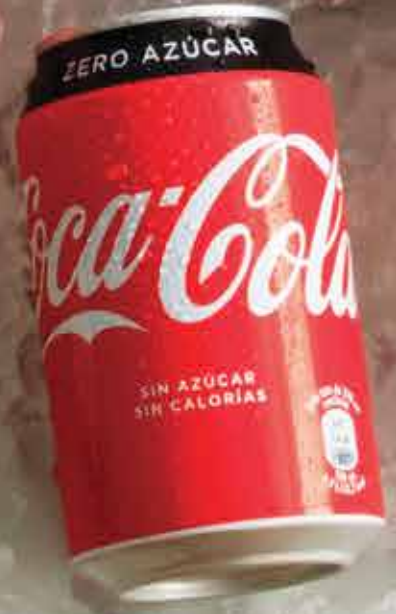
2,50€ Coca - Cola Zero Coke Zero Sugar