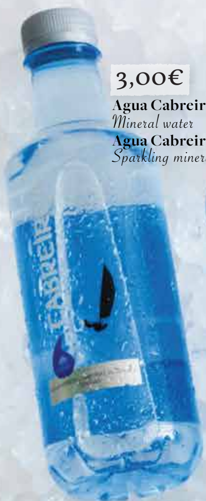
3,00€ Agua Cabreiroá 50 cl Mineral water Agua Cabreiroá con gas 50 cl Sparkling mineral water