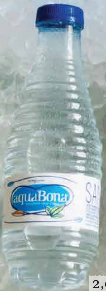
2,00€ Agua Aquabona 33 cl Aquabona mineral water