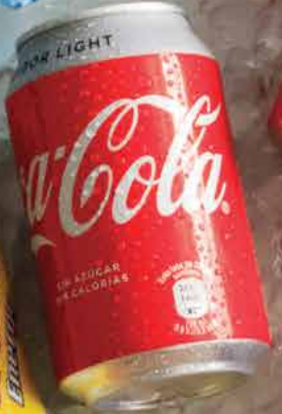
2,50€ Coca - Cola Coke Coca - Cola Light Diet Coke