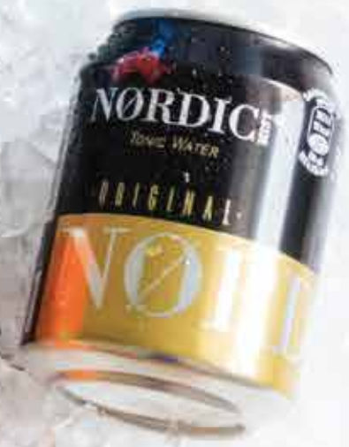
2,50€ Tónica Nordic Tonic water