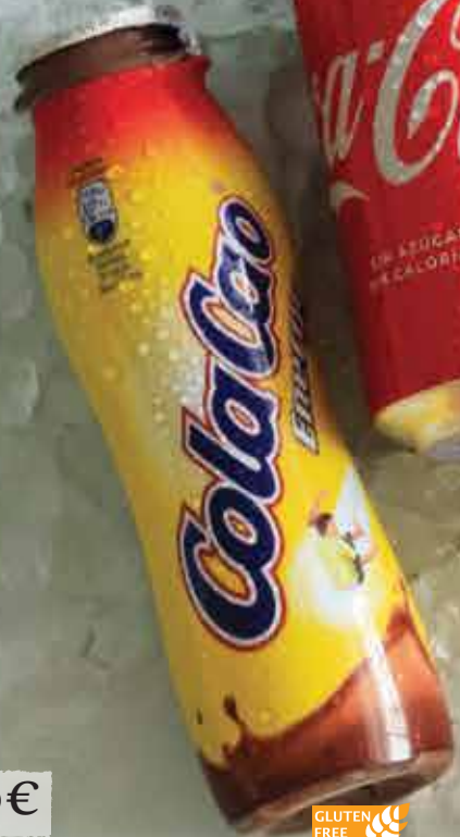
2,50€ COLAÇÃO GLUTEN FREE Cola cao Energy Chocolate drink