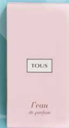
TOUS Parfum 30 ml